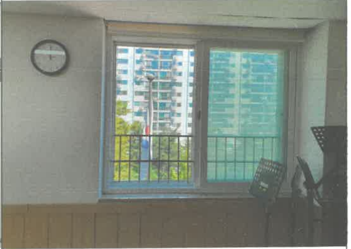
3층 소강당 방충망 1개소 교체