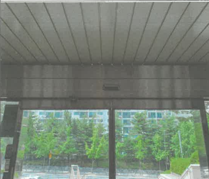
내부 센서 전원 들어오지 않음 예비 센서 1개소 교체