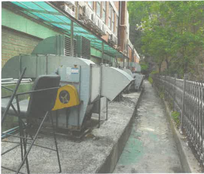
건물후면 각종 배기팬 점검 및 구리스 주입