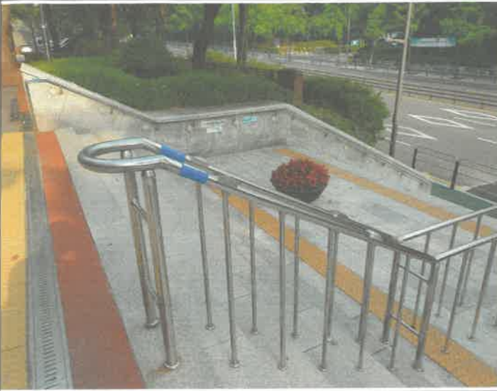
야외 중앙 계단 난간대 스토퍼 설치