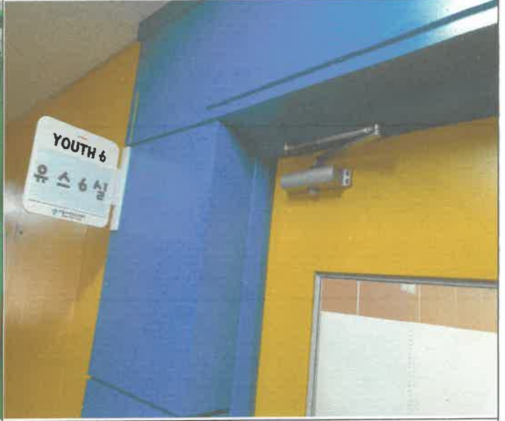
유스6실 출입문 도어 클로저져 탈거 되어 제설치