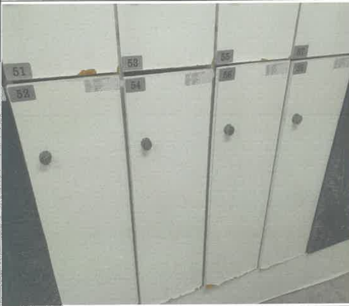
수영장 남자 탈의실 락카 경첩 탈거 되어 제 설치