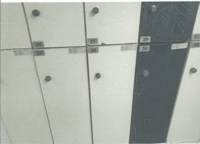
수영장 남자 탈의실 사물함 문짝 탈거 되어 제설치