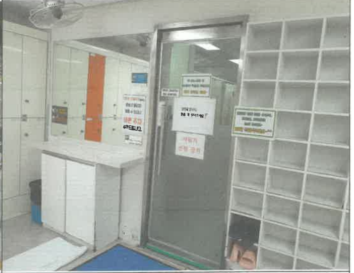
수영장 여자 샤워실 출입문 힌지 유격조정