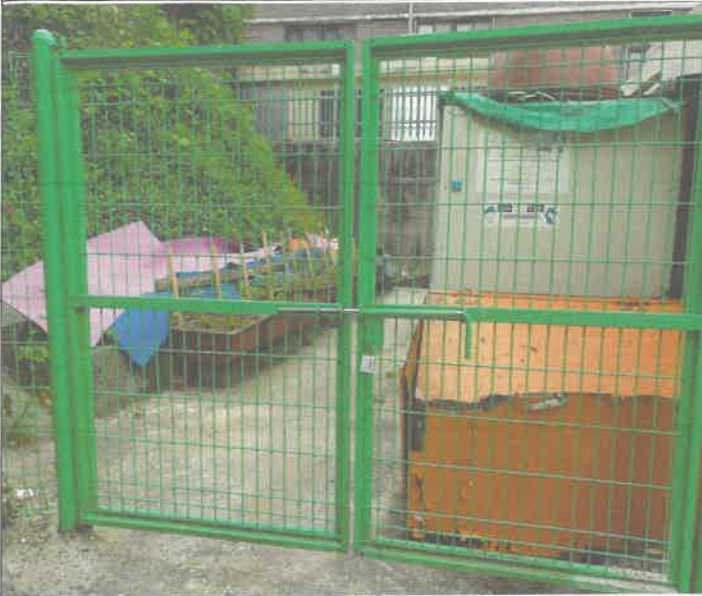
쓰레기장 출입구 시건 장치 설치