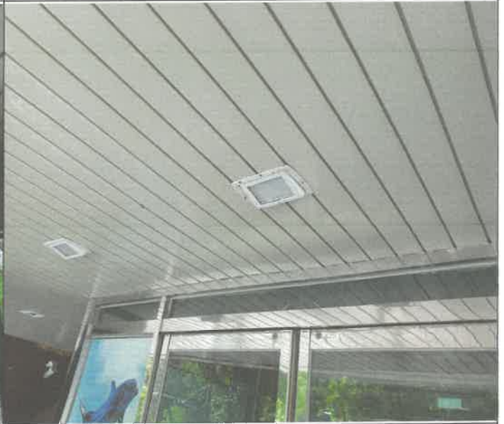
수영장 입구 천장 매립등 탈거 외에 제설치