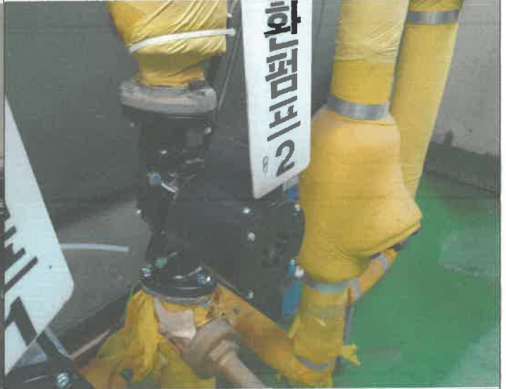
온수 순환펌프 교체 설치