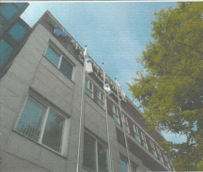
태극기 및 서울시기 교체