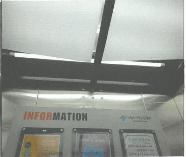
승강기 천장 등 점등 불량 1개소 교체