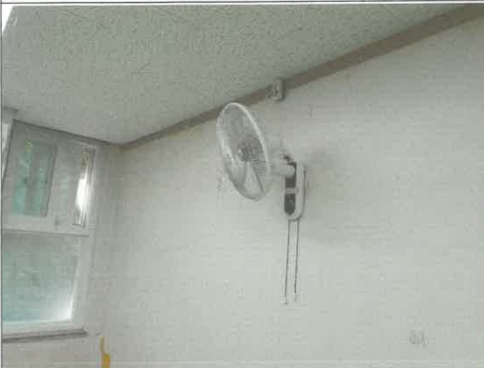
2층 (프)4실 벽걸이 선풍기 콘센트 설치