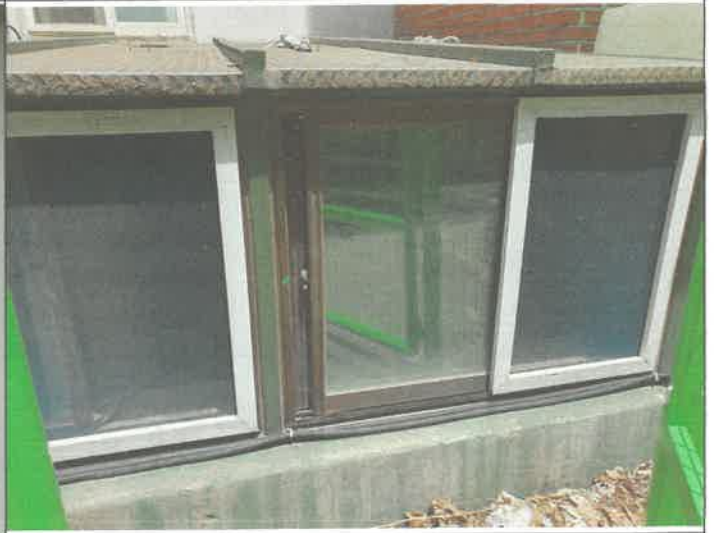
기계실 장비 반입구 방충망 교체 설치