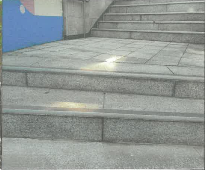
대 체육관 외부 계단 대리석 교정