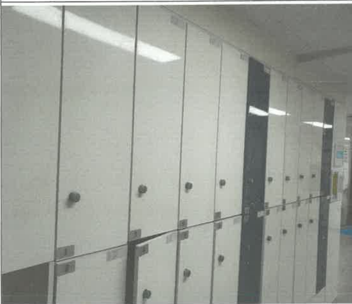
수영장 남자 탈의실 락카 문짝 1기 탈락보수