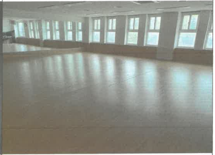
3층 소강당 출구 마루 노스립 해체 교정 수리 및 밀림방지턱 설치