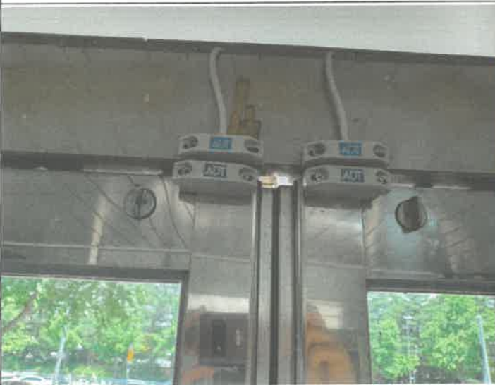
1층 주 출입구 자동문. 수동문 2개소 캡스 센서 교체