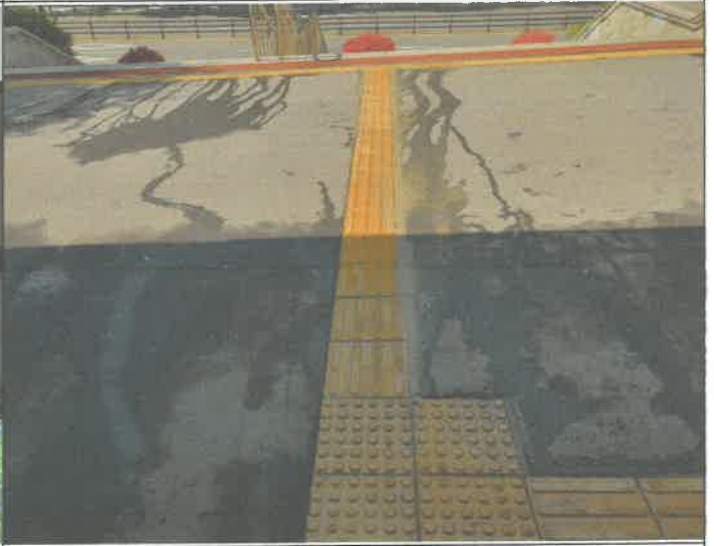
1층 주 출입구 외곽 점자 불력 시멘트 메지 시공