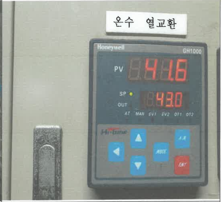
온수 열교환기 컨트롤 메인기판 수리