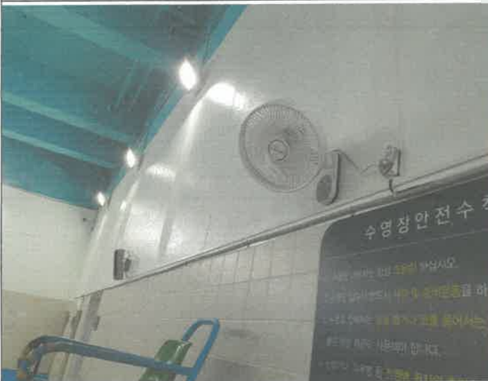
수영장 내부 안전감시자 망대 선풍기 설치