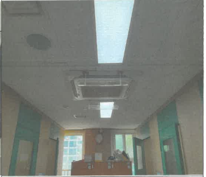
3층 피아노실 난방닥트 챔버 난방연결통로차단 및 냉방연결통로 조정