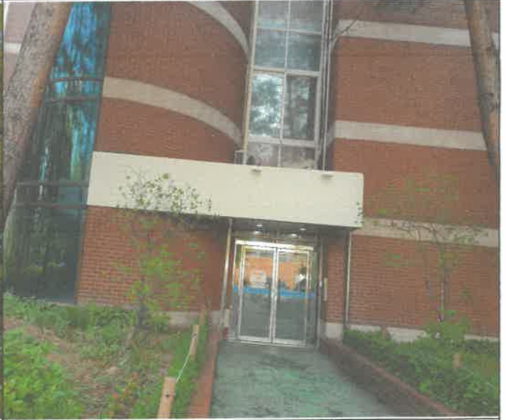
1층 방카쪽 방풍실 외부 벽면 도색