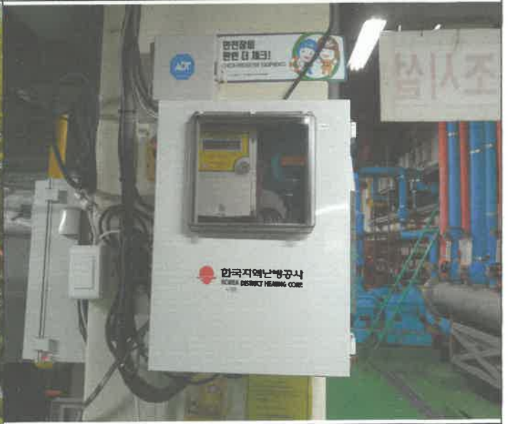
지역난방 온수 열량계교체